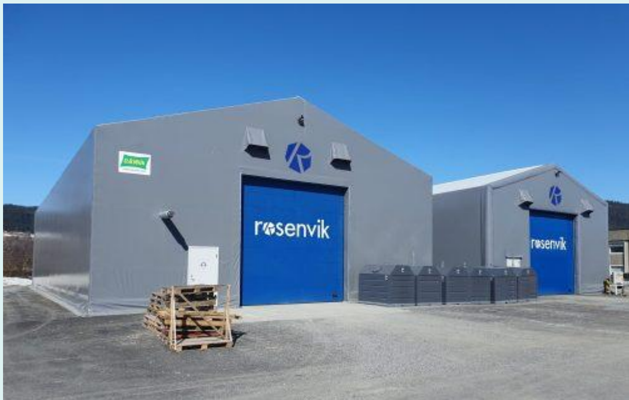
Grønørveien 51, Orkanger

Rosenvik AS' arbeidsarena Logistikk leier i dag ca. 800 kvm lager/produksjonsareal og et større uteareal av Grønørveien AS.