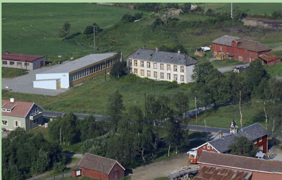
Første byggetrinn på Rosenvik i 1963, til venstre for gården